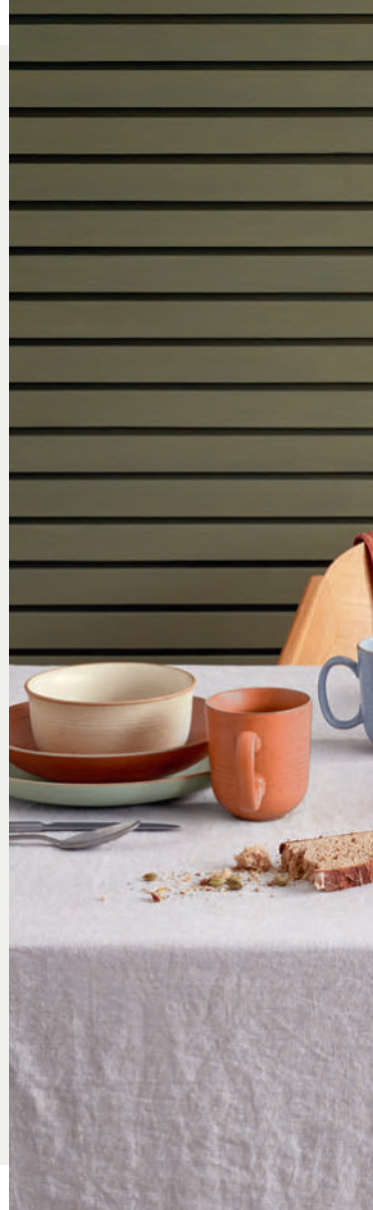
Cappuccinotasse 2-tlg. Cappuccino cup & saucer 0,27 l